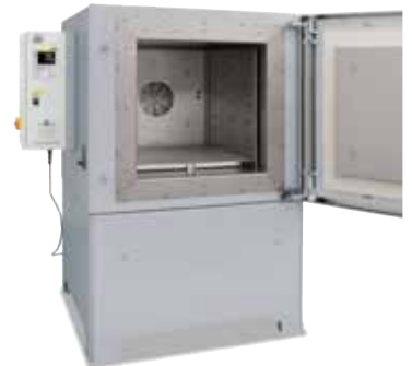
Камерная печь с циркуляцией воздуха NA 250/45 для тепловой обработки в воздушной среде