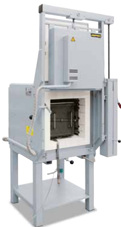
Камерная печь LH 60/12 с газационным коробом для тепловой обработки в атмосфере защитного газа