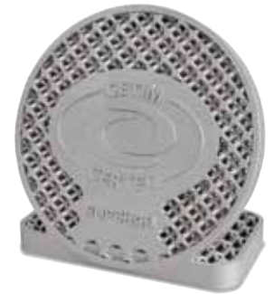
Печатная деталь из алюминия, с тепловой обработкой в модели N 250/85 HA (изготовитель CETIM CER-TEC на платформе SUPCHAD)

Указанные в таблицах модели представляют лишь некоторые примеры печей.