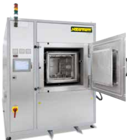
Ретортная печь VHT 100/12-MO с холодной стенкой для процессов в условиях высокого вакуума

Для процессов в среде защитного газа выше 1100 °C или в вакууме выше 600 °C используются ретортные печи с холодной стенкой.