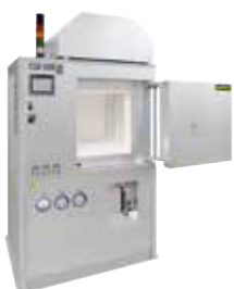
НТ 160/17 DB200 для удаления вязущих присадок и спекания керамических изделий после 3D-печати

Аддитивное производство позволяет осуществлять прямое преобразование файлов с данными конструкции в функциональные объекты. С помощью 3D-печати такие материалы, как металл, пластик, керамика, стекло, песок и т. д. обрабатываются пошагово до получения готового изделия.