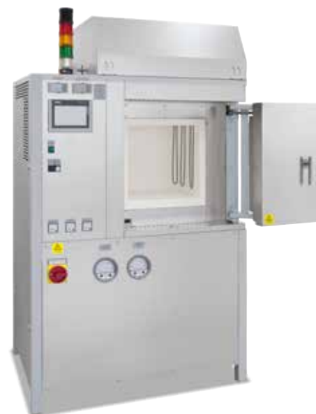
Высокотемпературная печь HT 64/17 DB100 с пассивной системой безопасности для очистки и спекания в воздушной среде