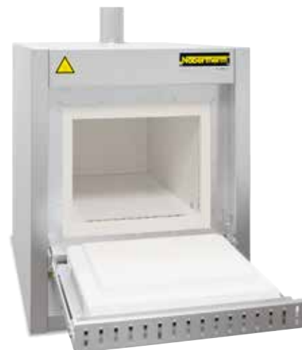
Муфельная печь L 40/11 BO с пассивной системой безопасности и встроенной системой дожигания для тепловой очистки в воздушной среде

2 Печи предлагаются в исполнениях с различной макс. температурой печного пространства