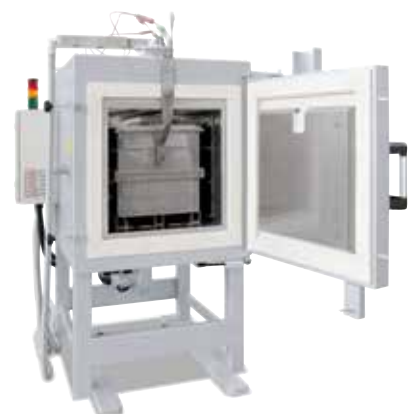
Камерная печь с циркуляцией воздуха N 250/85 HA с газационным коробом для тепловой обработки в атмосфере защитного газа