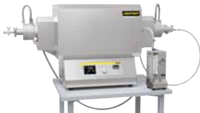
Компактная трубчатая печь для спекания или отжига со снятием напряжений после 3D-печати в среде защитного газа или вакуума