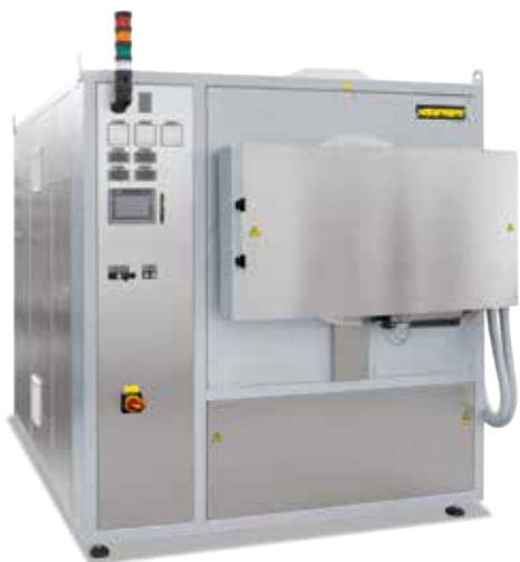
Ретортная печь с горячей стенкой NRA 150/09 для тепловой обработки в атмосфере защитного газа

При работе с чувствительными материалами, например титана, возможно окисление детали остаточным кислородом в газационном коробе.