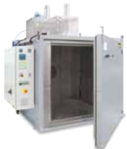
Сушильные камеры KTR 2000 для отверждения связующих веществ после 3D-печати