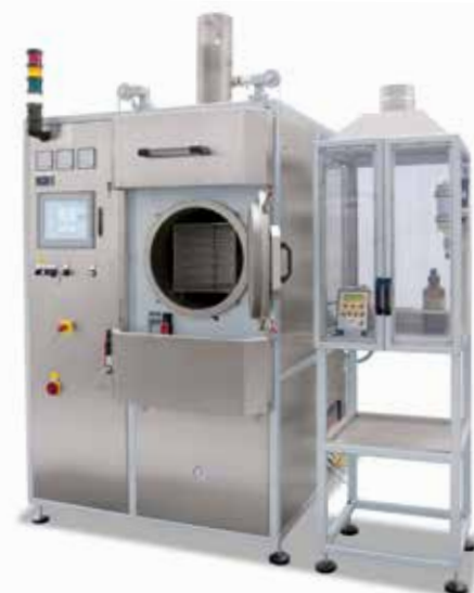
Ретортная печь NRA 40/02 CDB с приставным шкафом для кислотного насоса

3 С цементационным ящиком для остаточного удаления вяжущих веществ