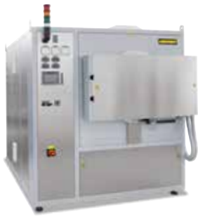
Ретортная печь NR 150/11, предназначена для отжига металлических деталей для снятия напряжений после 3D-печати