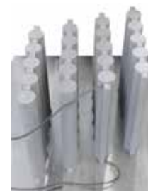
Растянутые стержни из титана после тепловой обработки в NR 50/11 в среде аргона