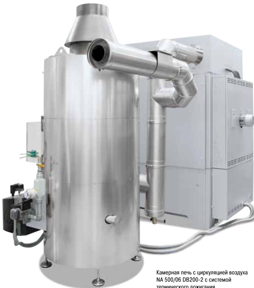
Камерная печь с циркуляцией воздуха NA 500/06 DB200-2 с системой термического дожигания