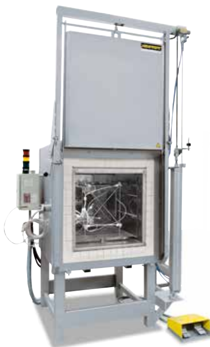
Измерительная рама для определения однородности температуры

В стандартной печи однородность температуры +/- К гарантируется без замера печи. Но в качестве дополнительного оборудования можно заказать модуль измерения однородности температуры при установке определенной температуры в полезном пространстве согласно DIN 17052-1. В зависимости от модели печи в ней размещается рама, которая соответствует размерам полезного пространства. На этой раме в заданных точках (11 точек прямоугольного сечения, 9 точек круглого сечения) измерения крепятся термоэлементы. Измерение распределения температуры осуществляется при температуре, заданной клиентом, по истечении предварительного установленного времени выдержки. При необходимости также можно откалибровать разные заданные температуры или определенный рабочий диапазон.