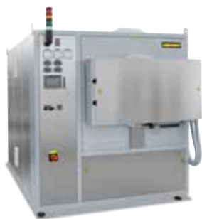
Ретортная печь NR 150/11, предназначена для отжига металлических деталей для снятия напряжений после 3D-печати