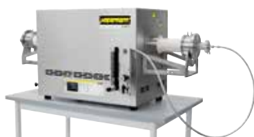
Компактная трубчатая печь для спекания или отжига со снятием напряжений после 3D-печати в среде защитного газа или вакуума