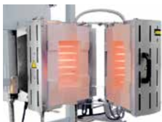
RS 100/250/11S в откидном исполнении для встраивания в испытательное устройство

Благодаря большой гибкости и инновациям фирма Nabertherm предлагает оптимальное решение задач клиентов.