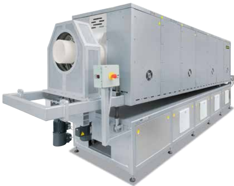
Ротационная трубчатая печь RSR 250/3500/15S