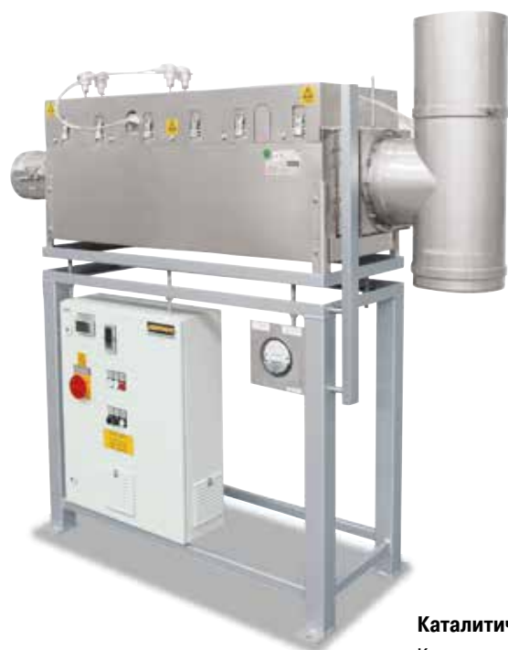
внепечное каталитическое дожигание для переоборудования существующих установок

Для очищения выпускаемого воздуха, особенно в процессах выжигания, компания Nabertherm предлагает подключаемые системы очистки выпускаемого воздуха. Процедура дожигания является неотъемлемой составляющей концепции защиты от отработанных газов в печи и, соответственно, включена в управление и матрицу защиты печи. Для уже установленных печных установок предлагаются автономные системы очистки от отработанных газов, управление и эксплуатация которых производится отдельно от печи.