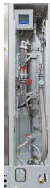
Система очистки технологических газов методом промывки

Газоочиститель зачастую применяется при образовании отводимых газов, которые не удается успешно обрабатывать с помощью факела для отводимых газов или системы термического дожигания. В зоне контакта очистителя нежелательные компоненты отводимых газов выводятся с промывочной жидкостью. Правильный выбор промывочной жидкости, а также исполнения системы подачи жидкости и зоны контакта очистителя позволяет адаптировать очиститель с ориентацией на процесс и эффективно удалять из отводимых газов газообразные, жидкие или твердые компоненты.