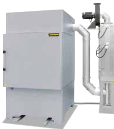
Камерная печь с циркуляцией воздуха NA 500/65 DB200 с установкой для каталитического дожигания