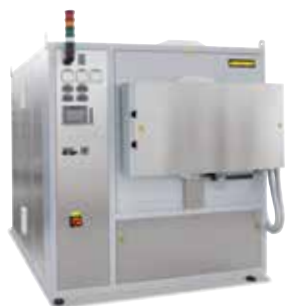
Ретортная печь NR 150/11, предназначена для отжига металлических деталей для снятия напряжений после 3D-печати