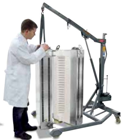
RS 120/1000/11S в двухсекционном исполнении. Обе полупечи имеют идентичное исполнение и для экономии места интегрируются в установку заказчика для подогрева газа.