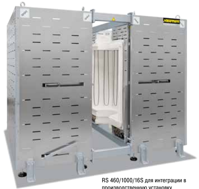
RS 460/1000/16S для интеграции в производственную установку

Благодаря большой гибкости и инновациям фирма Nabertherm предлагает оптимальное решение задач клиентов.