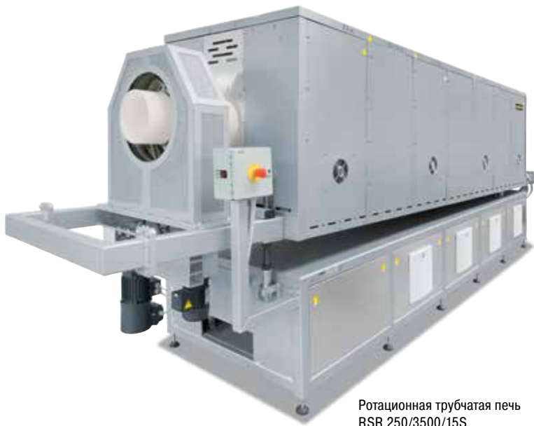
Ротационная трубчатая печь RSR 250/3500/15S