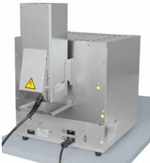
Стандартная лабораторная муфельная печь L 5/11 с катализатором KAT 50, см. страницу 12

Для очищения выпускаемого воздуха, особенно в процессах выжигания, компания Nabertherm предлагает подключаемые системы очистки выпускаемого воздуха. Процедура дожигания является неотъемлемой составляющей концепции защиты от отработанных газов в печи и, соответственно, включена в управление и матрицу защиты печи. Для уже установленных печных установок предлагаются автономные системы очистки от отработанных газов, управление и эксплуатация которых производится отдельно от печи.