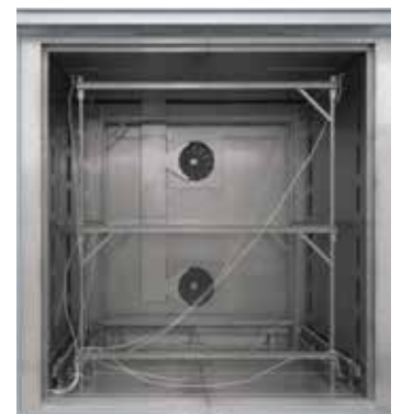
Съемная мерная стойка для конвекционной камерной печи N 7920/45 HAS