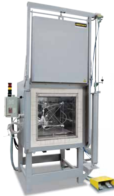
Измерительная рама для определения однородности температуры

В стандартной печи однородность температуры +/- К гарантируется без замера печи. Но в качестве дополнительного оборудования можно заказать модуль измерения однородности температуры при установке определенной температуры в полезном пространстве согласно DIN 17052-1. В зависимости от модели печи в ней размещается рама, которая соответствует размерам полезного пространства. На этой раме в 11 заданных точках измерения крепятся термоэлементы. Измерение распределения температуры осуществляется при температуре, заданной клиентом, по истечении предварительного установленного времени выдержки. При необходимости также можно откалибровать разные заданные температуры или определенный рабочий диапазон.