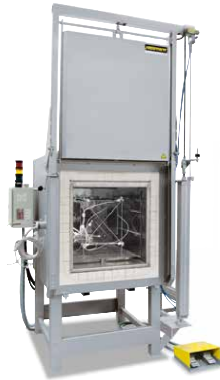
Измерительная рама для определения однородности температуры

В стандартной печи однородность температуры +/- К гарантируется без замера печи. Но в качестве дополнительного оборудования можно заказать модуль измерения однородности температуры при установке определенной температуры в полезном пространстве согласно DIN 17052-1. В зависимости от модели печи в ней размещается рама, которая соответствует размерам полезного пространства. На этой раме в 11 заданных точках измерения крепятся термоэлементы. Измерение распределения температуры осуществляется при температуре, заданной клиентом, по истечении предварительного установленного времени выдержки. При необходимости также можно откалибровать разные заданные температуры или определенный рабочий диапазон.