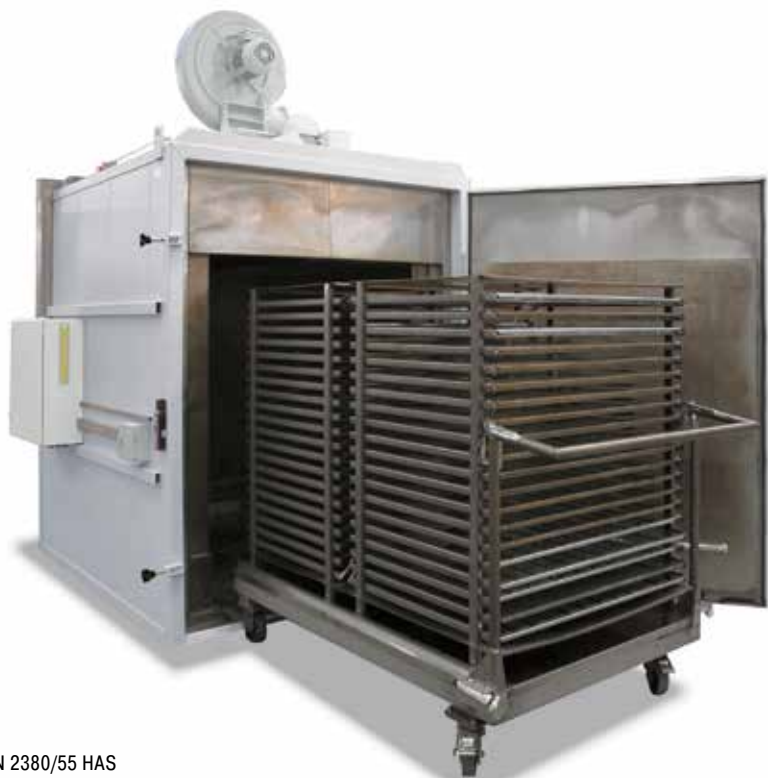
N 2380/55 HAS Печная установка с циркуляцией воздуха, включая загрузочную тележку для отпуска плоских листов

Пространство печи с загрузочными решетками в печи с циркуляцией воздуха. Задвижные листы перемещаются отдельно по телескопическим шинам. Таким образом их можно вытягивать по отдельности.