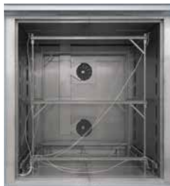
Съемная мерная стойка для конвекционной камерной печи N 7920/45 HAS

Под однородностью температуры подразумевается определенное максимальное отклонение температуры в полезном пространстве печи. При этом необходимо различать газовое и полезное пространство. Газовое пространство представляет собой общий объем печи. Полезное пространство меньше газового и представляет собой объем, который можно использовать для загрузки.