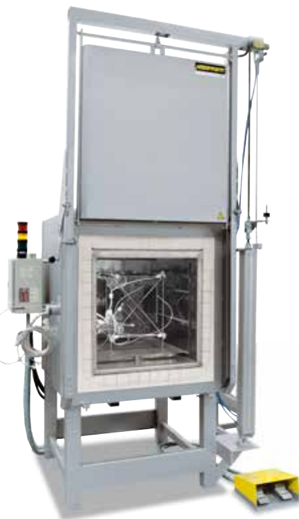
Измерительная рама для определения однородности температуры