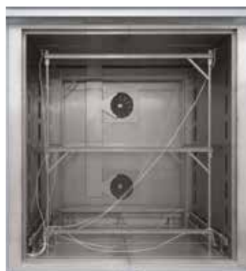
Съемная мерная стойка для конвекционной камерной печи N 7920/45 HAS

Под однородностью температуры подразумевается определенное максимальное отклонение температуры в полезном пространстве печи. При этом необходимо различать газовое и полезное пространство. Газовое пространство представляет собой общий объем печи. Полезное пространство меньше газового и представляет собой объем, который можно использовать для загрузки.